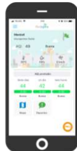
Fig. Pantalla principal de la aplicación Redspira