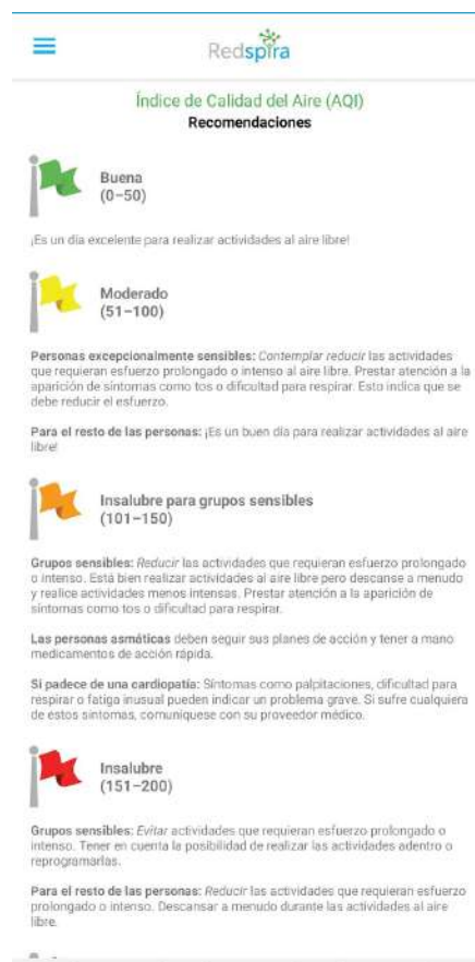
Tabla. Banderas de colores relacionadas con el semáforo de AQI.

Tanto la plataforma web como las aplicaciones móviles muestran la información de la calidad del aire utilizando el instrumento de difusión del Índice de Calidad del Aire (AQI), que traduce los niveles de concentración de contaminantes en índices, categorías y escalas de color fáciles de entender. También incluye recomendaciones para la salud basadas en el semáforo.